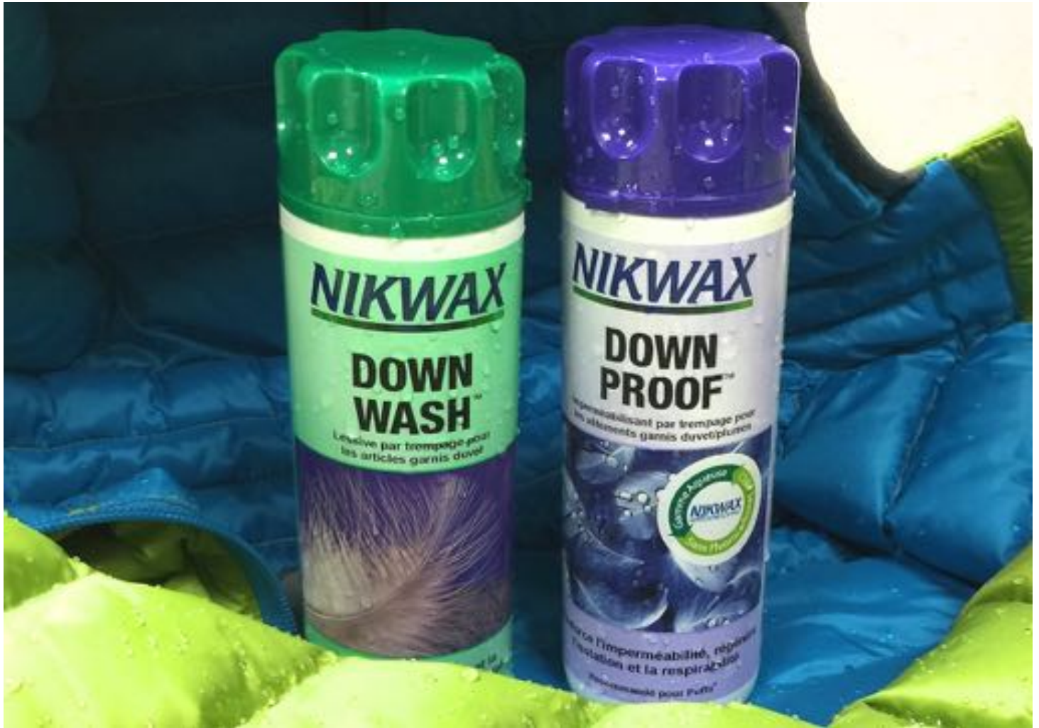
NIKWAX Down Wash et NIKWAX Down Proof