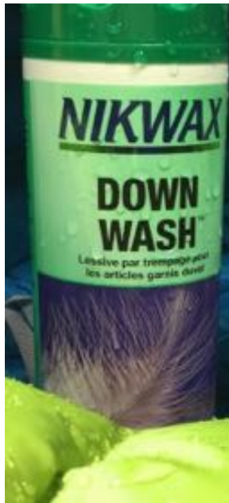
NIKWAX Down Wash