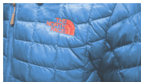
La doudoune Primaloft Thermoball The North Face Dans "Actus Matos"

DOUDOUNE DOWN DUVET IMPERMÉABILISANT NIKWAX PLUME SAC DE COUCHAGE