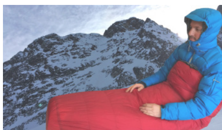
Le sac de couchage pied d'éléphant, by SIR JOSEPH Dans "Actus Matos"