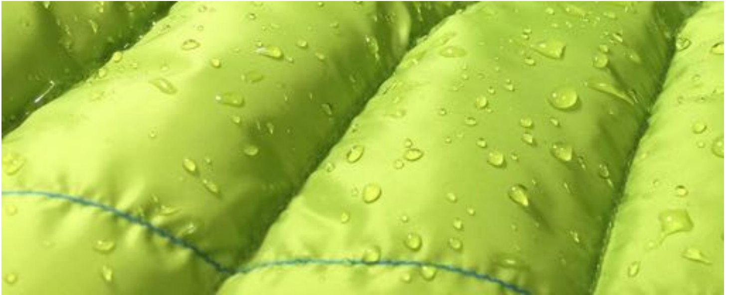
Zoom sur une doudoune parfaitement imperméabilisée (effet déperlant).

n'offre autant d'isolation pour si peu de poids. La structure du duvet permet que l'air soit retenu entre ses filaments et qu'il soit chauffé par la chaleur corporelle afin de fournir une isolation maximale à l'utilisateur.