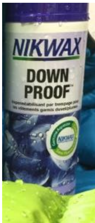
NIKWAX Down Proof